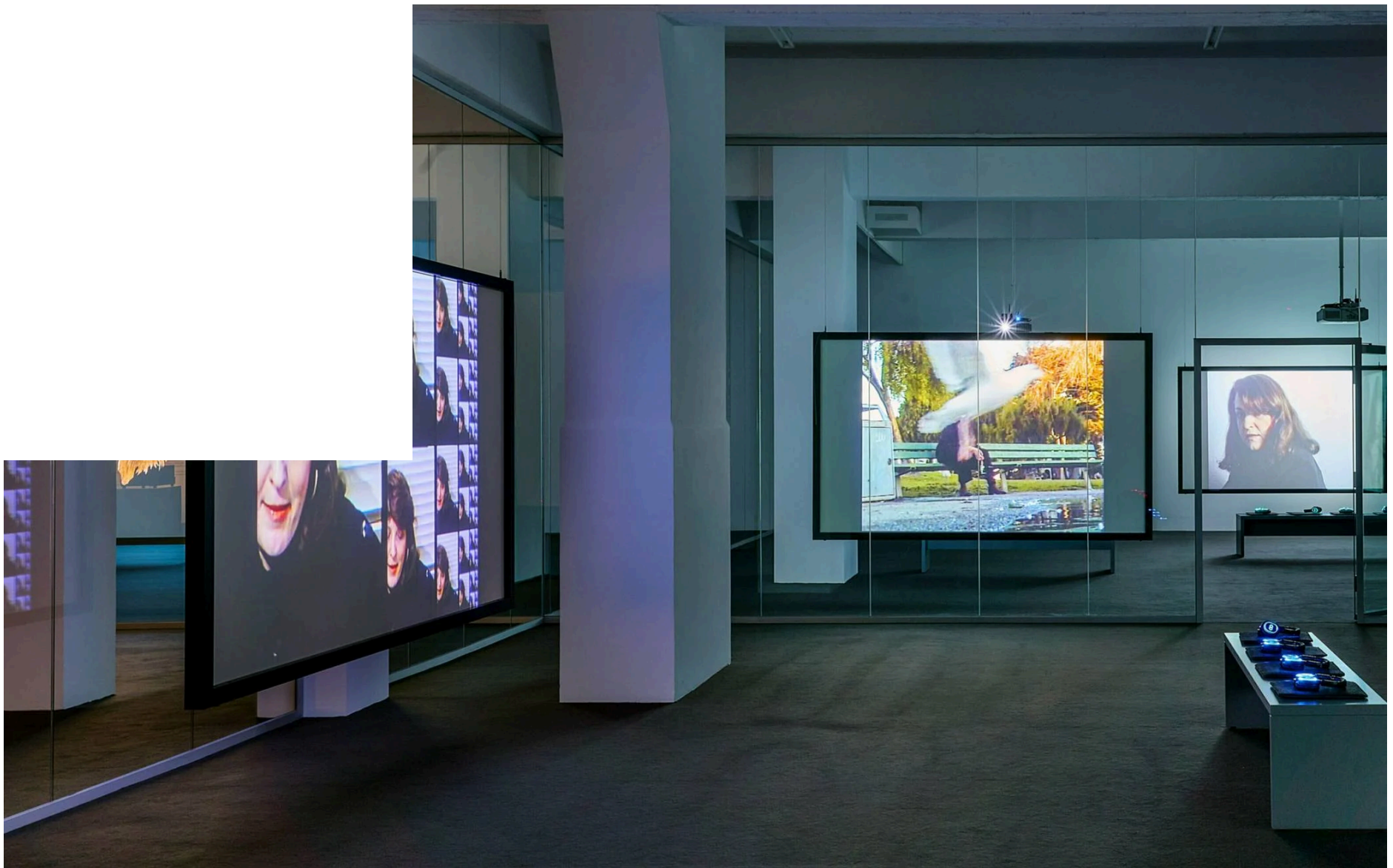
Installation view from Lynn Hershman Leeson, "Are our Eyes Targets" at JSF Düsseldorf.